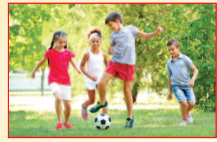
अवॉयड करें। बच्चों को ज्यादा नमक वाली चीजें जैसे- पैकेजड फूड, आचार, पापड, चिप्स, बिस्कुट, नमकीन, सॉस कम दें। टीवी और मोबाइल स्क्रीन का समय सीमित करें, सेडेंटरी लाइफस्टाइल से दूर रहें और रोजाना क्षमतानुसार फिजिकल एक्टिविटीज वाले गेम खेलने या एक्सरसाइज करने के लिए बच्चों को प्रेरित करें। माता-पिता अगर हाई बीपी की समस्या से पहले से पीड़ित हैं, तो गर्भावस्था में बच्चे को इसका शिकार होने से बचाने के लिए डॉक्टर की सलाह जरूर लें।

क्या होता है असर: बच्चे में अगर लंबे समय तक हाई ब्लड प्रेशर रहता है, तो उसके कारण हार्ट में हाइपरट्रोफी की समस्या हो जाती है। इसमें हार्ट मसलस की थिकनेस बढ़ जाती है, जिससे हार्ट की पंपिंग पर असर पड़ता है या डायस्टोलिक फंक्शन धीरे-धीरे कम हो जाता है। ब्रेन, हार्ट, आइज, किडनी को नुकसान पहुंचने की संभावना रहती है। बढ़ा हुआ बीपी धीरे-धीरे हार्ट की धमनियों पर दबाव डालता है, जिससे हार्ट डिजीज होने या हार्ट अटैक होने की आशंका रहती है। आर्टरीज फ्ट सकती हैं और उनमें क्लॉटिंग होने से ब्रेन हैमरेज या ब्रेन स्ट्रोक हो सकता है। किडनी डैमेज होने का खतरा बढ़ जाता है। क्या है उपचार: अगर ब्लड प्रेशर बार-बार हाई आ रहा हो या उसकी हार्ट की पंपिंग कम हो रही हो तो बच्चे को ज्यादा एक्टिविटीज करने से मना किया जाता है और उसे आईवी यानी नस के माध्यम से मेडिसिन दी जाती है। बच्चे के नॉर्मल होने पर ओरल लिक्विड मेडिसिन पानी में मिलाकर दी जाती है। साथ ही डॉक्टर मरीज को यथासंभव लाइफस्टाइल मॉडिफिकेशन करने की भी सलाह देते हैं जैसे- बीपी रेग्युलर चेक कराने, प्रोसेसड जंक फूड या ऑयली फूड से परहेज, कम नमक वाला खाना खाने, रेग्युलर कार्डियक एक्सरसाइज करना। मेडिसिन आमतौर पर लंबे समय तक चलती है लेकिन कई मामलों में बच्चे का ब्लड प्रेशर नॉर्मल हो जाता है या फिर हार्ट की बनावट में सुधार होने या किडनी की बीमारी ठीक होने के बाद बीपी कंट्रोल में आ जाता है। ऐसी स्थिति में बच्चे की मेडिसिन डॉक्टर के सुपरविजन में धीरे-धीरे बंद कर दी जाती है। पैरेंट्स को रेग्युलर डॉक्टर के संपर्क में रहना चाहिए। मेडिसिन लेने में किसी तरह की लापरवाही नहीं बरतनी चाहिए। * प्रस्तुति: रजनी अरोड़ा