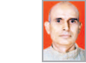
(लेखक पंचांग विधि चंडीगढ़ में वरिष्ठ प्रवक्ता हैं, ये उनके अपने विचार हैं।)