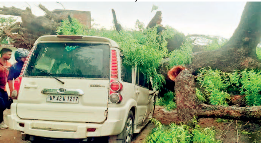
एजेंसी ►► लखनऊ

वायुमंडल के निचले क्षोभमंडल में वेस्ट यूपी के ऊपर चक्रवाती परिस्थिति बन गई। साथ ही दक्षिण राजस्थान से आ रही पुरवा की मदद मिलने से बुधवार को उत्तर प्रदेश में 100 किलोमीटर प्रतिघंटा की रफ्तार तक आंधी है। नतीजतन प्रदेश में बुधवार को कुदरत का कहर टूट पड़ा। दोपहर बाद प्रदेश के अलग-अलग हिस्सों में आई भीषण आंधी और बारिश के कारण हुए हादसों में अब तक कुल 52 लोगों की मौत हो चुकी है।